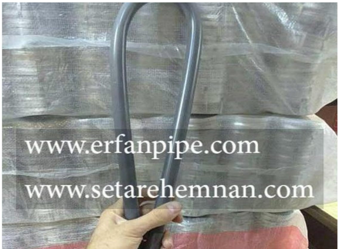
لوله خم گرم :: Hot right angel